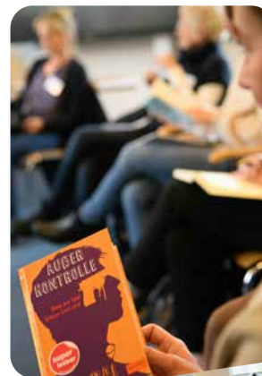
Impressionen vom 5. Leseweiterbildungstag 2023